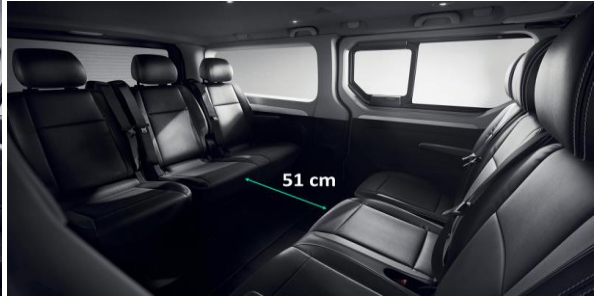
Adaptabilitate: bancheta cu 3 locuri de pe randul 2 poate fi repositionata astfel incat pasagerii sa poarte conversatii fara sa depuna prea mult efort