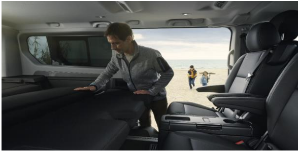
Ai avut o saptamana grea in care Spaceclass ti-a servit drept birou, sala de sedinte sau locul unde ai servit masa in tihna? Weekend-ul este aici si familia doreste sa evadeze din mediul urban? Cu pachetul Escapade transformi Spaceclass-ul din birou in rulota si evadezi din cotidian.