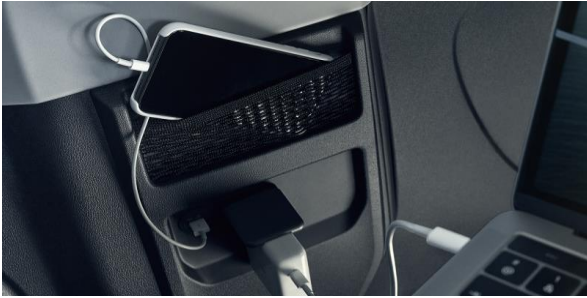
Business trip? Ai tot ce iti trebuie pentru a iti desfasura activitatea pe parcursul calatoriei: priza pentru laptot, mufa USB pentru incarcarea telefonului mobil, sala de sedinte, scaune confortabile si o capacitate de pana la 5 locuri pe randurile 2 si 3