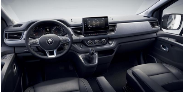
Design bord unic Spaceclass