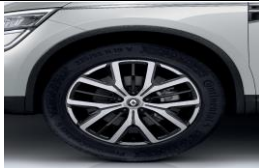
Jante de aliaj de 19" design Biton