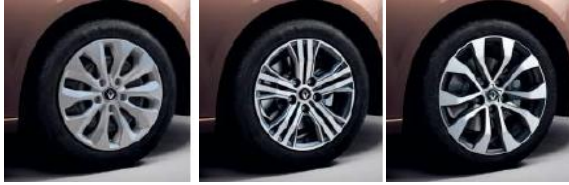
Jante otel 16", design Florida