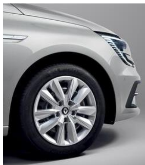
Jante de otel 16" Flexwheel, design Elliptik