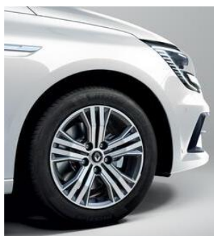
Jante aliaj 16", design diamantat Impulse