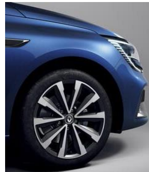
Jante aliaj 17" design diamantat Monthéry