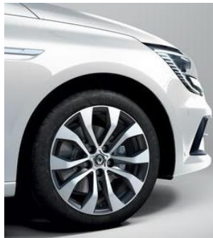
Jante aliaj 17" design ALLIUM