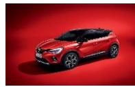
ROUGE FLAMME & BLACK BIXPA : NNP + GNE